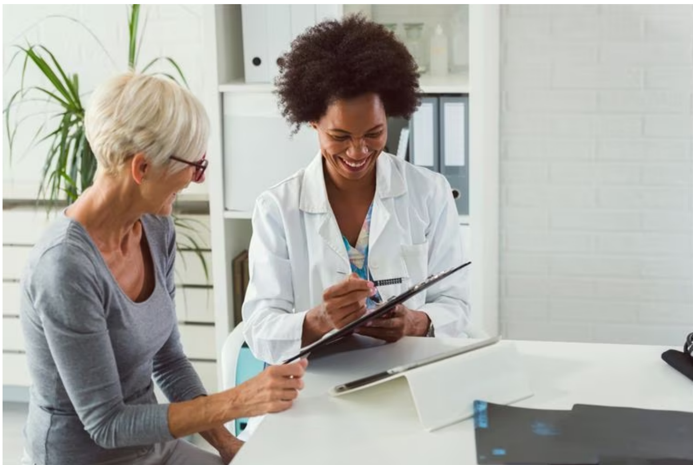
Parler la langue du patient, un enjeu majeur pour garantir la qualité des soins de santé.